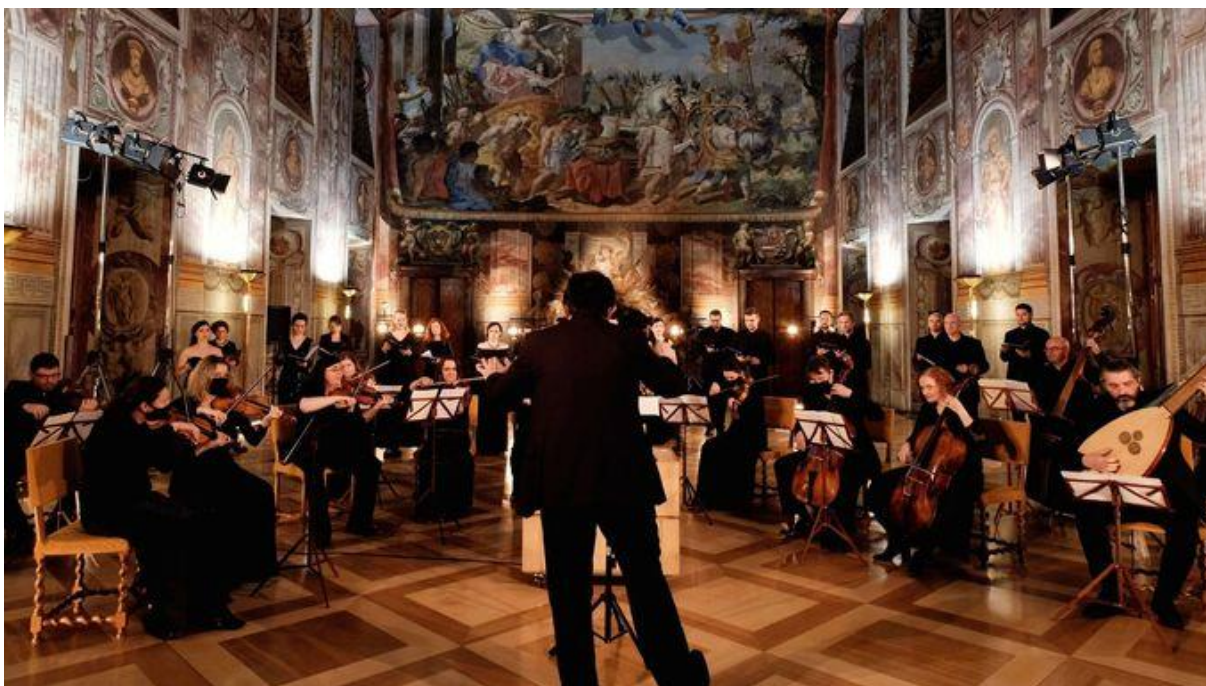
Snímek z koncertu v Trojském zámku.