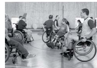
Kemp českých a německých vozíčkářů a jejich asistentů

Fond budoucnosti tak jako v minulých letech podpořil i projekty menšinových spolků a organizací, ať už se jednalo o lužicko-srbskou menšinu v Německu nebo o menšinové spolky Němců v Čechách. Tyto organizace a spolky se často věnují folkloristické činnosti a získané prostředky jim pomáhají prezentovat lidové umění na veřejných vystoupeních.