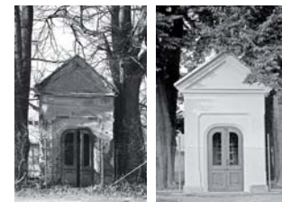
Obnova kapličky v Liberci-Starých Pavlovicích

Česko-německý fond budoucnosti přispěl finančně také na celou řadu menších vzdělávacích akcí, jako jsou např. interkulturní semináře, dramatická výchova, školení redaktorů školních časopisů, školení o politické kultuře, badatelské pobyty studentů atd.