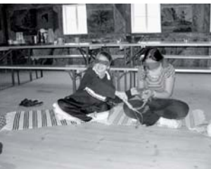
Ekologická výchova v centru Suchopýr

ci mezi kulturními institucemi, organizacemi a iniciativami s přeshraničními zájmy, které jsou v rámci celého festivalu úspěšně integrovány.