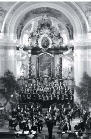
Rekonstrukce barokního chrámu sv. Mikuláše v Boru u Tachova