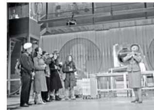
Pražský divadelní festival německého jazyka – Burgtheater Wien