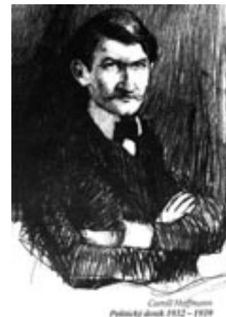
Camill Hoffmann Politický deník 1932–1939

K nejzajímavějším knihám, jejichž vydání Fond budoucnosti v roce 2006 podpořil, patří zcela jistě Politický deník dlouholetého tiskového atašé československého velvyslanectví v Berlíně Camilla Hoffmanna (viz foto). Hoffmann, český Žid, německý básník a československý diplomat, popisuje ve svém deníku bezprostředně, i když s kritickým