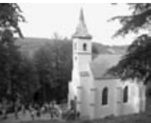
Kaple Panny Marie Lurdské u Chrobol

Příkladem velmi dobré spolupráce rodáků a diecézí