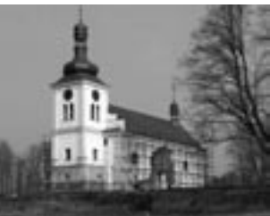
Kostel sv. Martina v Markvarticích

Rok 2006 byl již devátým rokem spolupráce koordinační komise, zastupující Český svaz bojovníků za svobodu a Federaci židovských obcí, na projektu humanitární pomoci pro české oběti nacionálně socialistického násilí. Objem prostředků, vyhrazených pro tento projekt, představuje v souladu se statutem Česko-německého fondu budoucnosti 90 milionů DM. Doba trvání projektu je nastavena na 10 let.